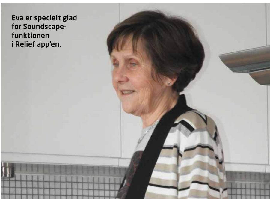
Eva er specielt glad for Soundscape-funktionen i Relief app'en.

Har du lyst til at prøve GN Hearings app, så søg på ReSound Tinnitus Relief i App Store eller på Google Play. 📍